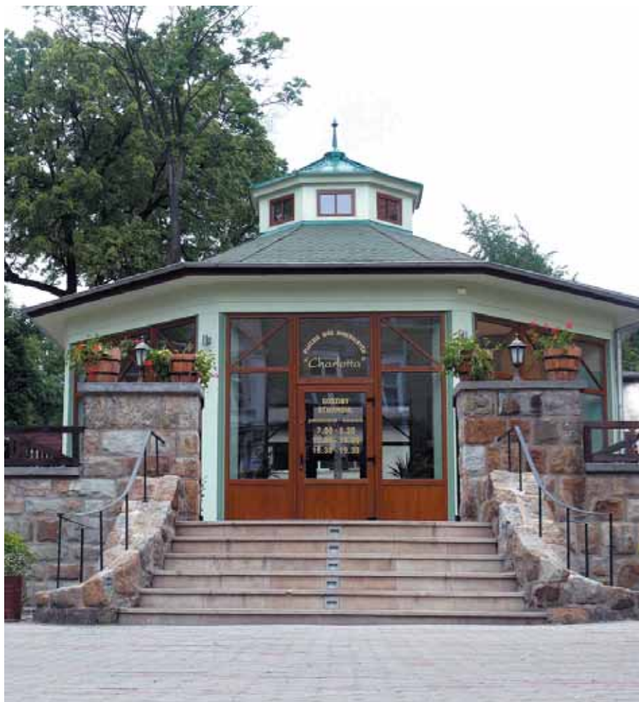
Pijalnia wód mineralnych "Charlotte" w Jedlinie-Zdroju.

- Otwarcie Pijalni Wód Mineralnych „Charlotte” w Jedlinie — Zdroju jest dla Województwa Dolnośląskiego tak samo ważne, jak otwarcie kolejnej fabryki, w którejś ze specjalnych stref ekonomicznych —