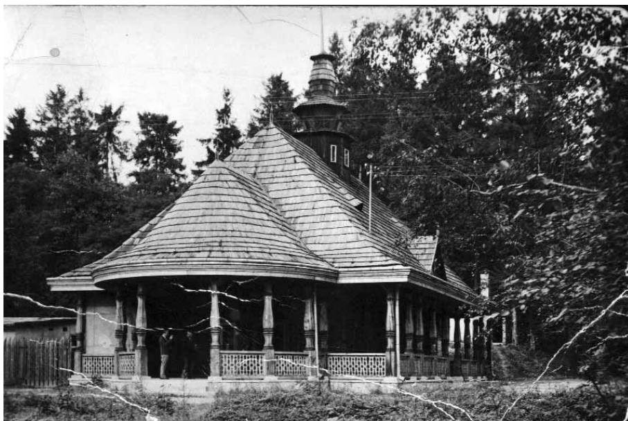
Archiwalna fotografia pijalni wód mineralnych, która została całkowicie zniszczona w latach 60-tych

Wysowa-Zdrój zwana niegdyś polskim Merano, to małe (6500 mieszkańców) lecz bardzo cenione uzdrowisko, znane przede wszystkim z ogromnego bogactwa złóż wód mineralnych. Na bazie tego naturalnego skarbu produkuje się słynną Wysowiankę. Obecnie Wysowa-Zdrój dysponuje 14 ujęciami wód mineralnych, ich różnorodność i naturalne właściwości wspomagają leczenie wielu schorzeń m. in. układu oddechowego, pokarmowego i moczowego.