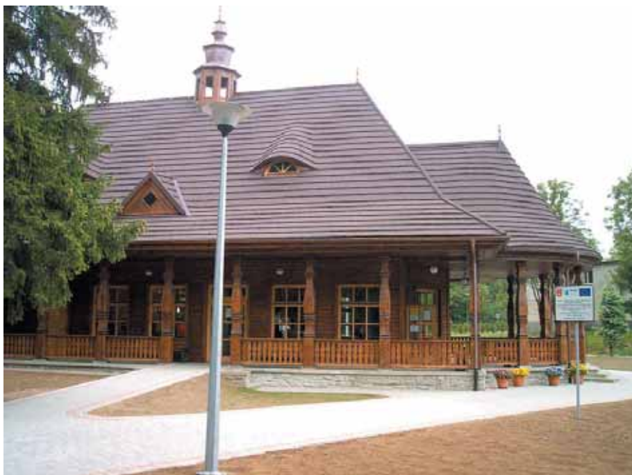
Nowy budynek pijalni wód mineralnych zaprojektowany w miejscu i na wzór dawnej pijalni wód mineralnych w Wysowej-Zdroju

do piątku od godz. 10 do 12 i od 14 do 18. W soboty i niedziele od godz. 12 do 18. Decyzja o jej wybudowaniu, usytuowanie pijalni i doskonałe uchwycenie podobieństwa do oryginału niewątpliwie wpłynęły na podniesienie rangi i konkurencyjności uzdrowiska.