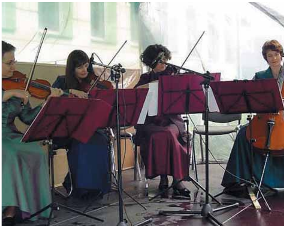
Występ kwartetu smyczkowego muzyki kameralnej Sotto Voce podczas uroczystości jubileuszowych

i pensjonaty. W planach jest budowa nowoczesnej kliniki kardiologicznej i ginekologicznej. Solecka woda pomaga bowiem leczyć bezpłodność. W najbliższych latach rozpocznie się budowa zespołów basenów termalnych.