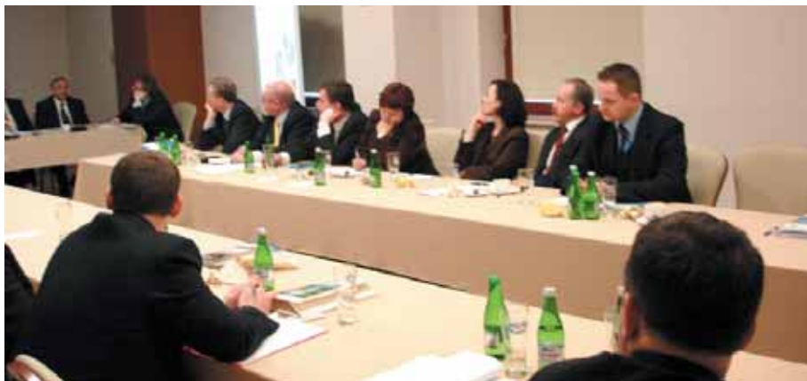
Uczestnicy i delegaci gmin uzdrowiskowych podczas walnego zebrania SGU RP

wpływu na ostateczny kształt ustawy (poprawki mógł zgłosić tylko rząd), wprowadzono zmiany, które do dziś są powodem frustracji. Niemniej ustawa z 5 lipca 2005 r. "o lecznictwie uzdrowiskowym, uzdrowiskach i obszarach ochrony uzdrowiskowej oraz o gminach uzdrowiskowych" wpisuje się na listę sukcesów Stowarzyszenia.