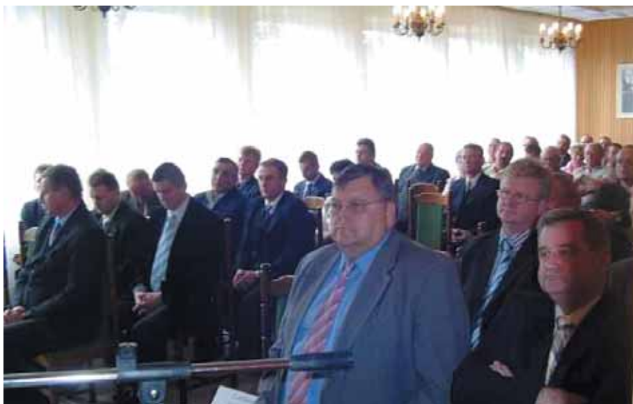
Uczestnicy i Goście Jubileuszowej Sesji Rady Gminy w Solcu-Zdroju